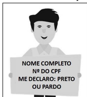
Figura 3. Modelo de Autodeclaração para o vídeo.