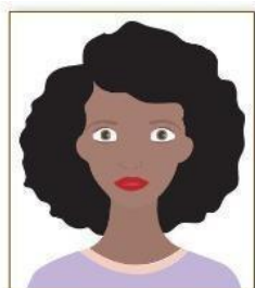
Figura 1. Modelo de Foto Frontal.